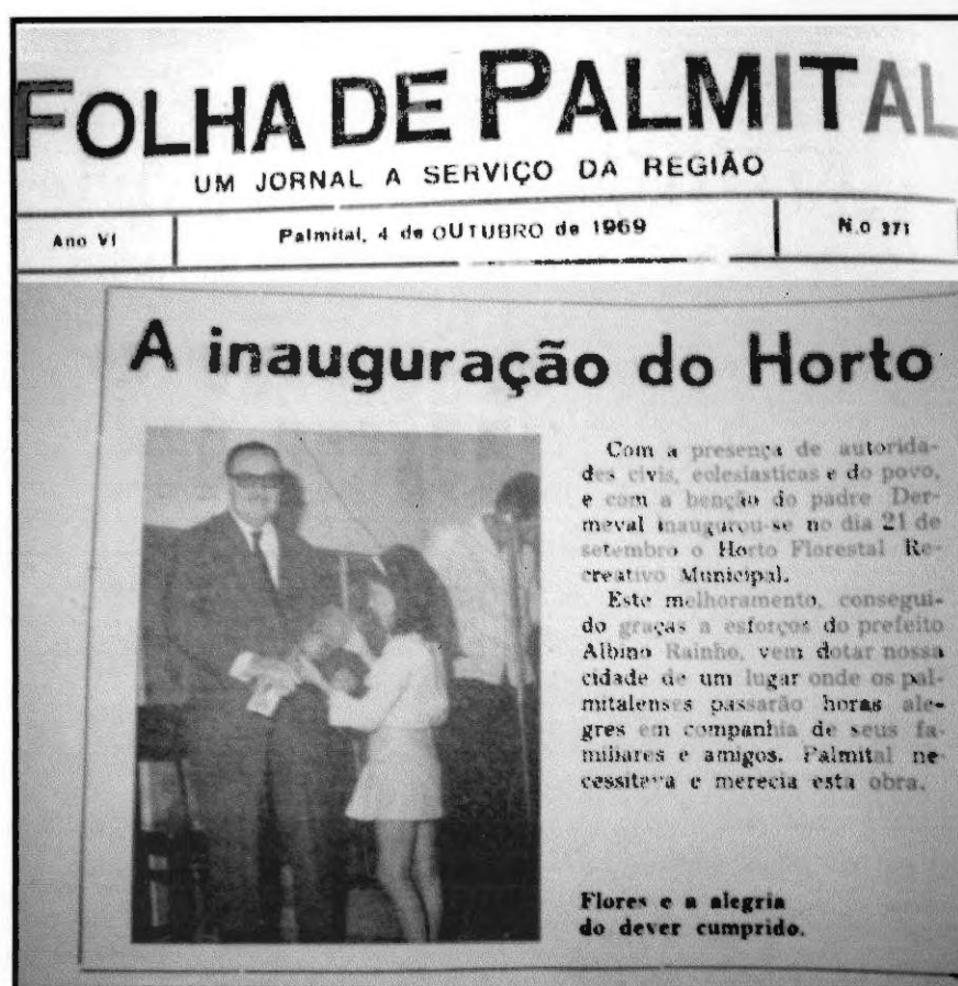
Figura 3 – Inauguração do Horto – Jornal Folha de Palmital 04.10.1.969.