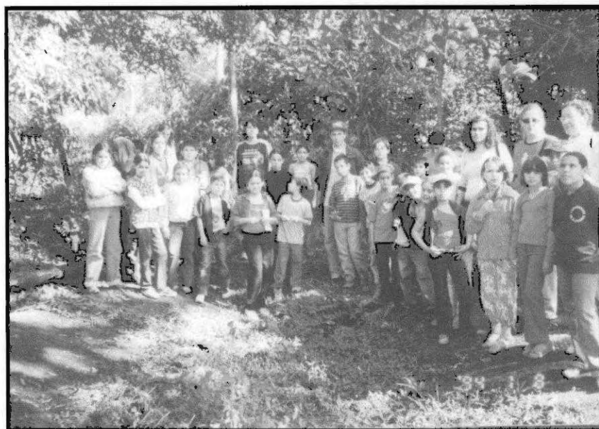
Figura 5 - Programa "Na trilha da Árvore".