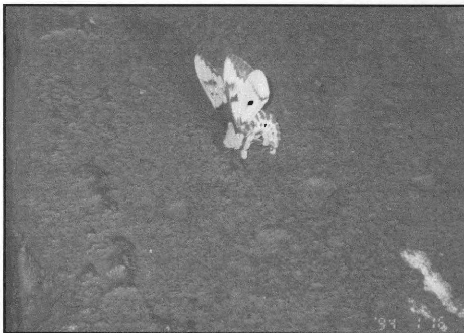
Figura 13 – Mariposa existente no horto..