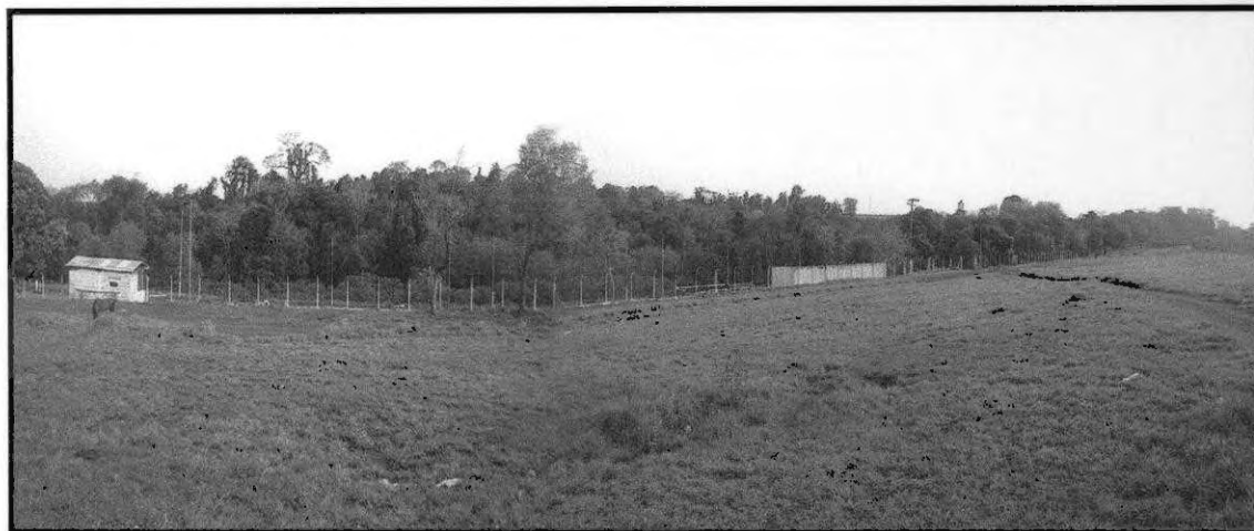
Figura 4 - Visão panorâmica do horto. (Fonte: Folha de Palmital).

Os legisladores municipais entenderam que o horto, por ser uma área de mananciais, fonte responsável pelo abastecimento de água da cidade, teria que ser protegida por lei e não pode ser desmatada. A vegetação tem um papel muito importante no ciclo da água, pois uma parte dela é absorvida pelas raízes e acaba voltando à atmosfera pela transpiração ou pela evaporação direta. As plantas têm a função de encurtar o ciclo da água, garantindo a sua permanência em uma determinada região. Além de contribuir na manutenção da qualidade dos solos, evitando a erosão e o assoreamento dos rios.