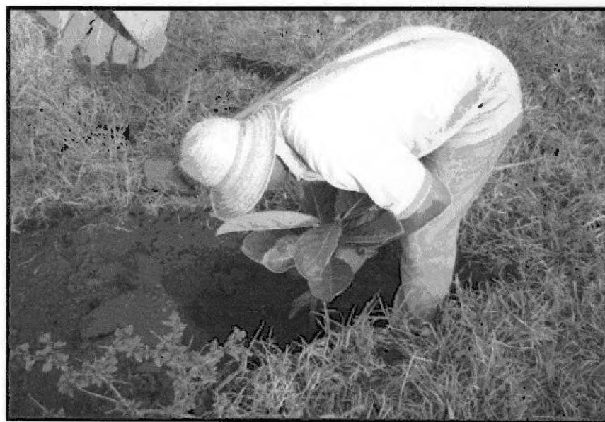
Figura 6 – Plantio de Árvore.