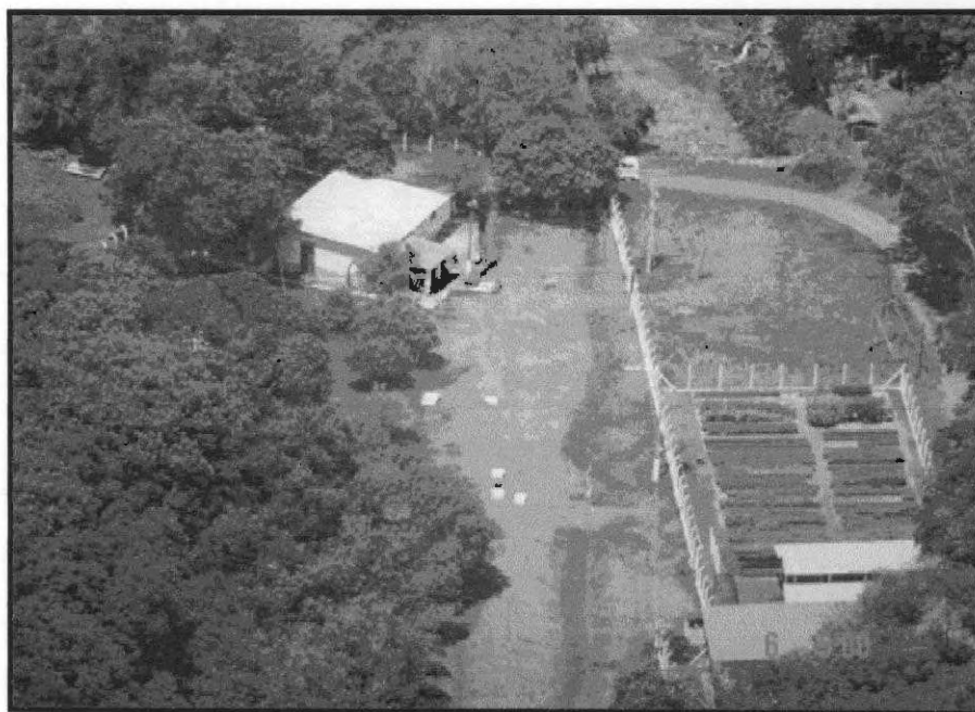
Figura 12 - vista área do manancial. (Fonte SAAE – Palmital).