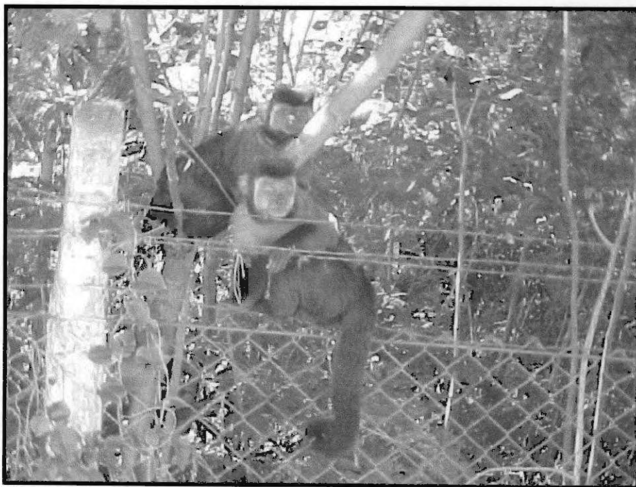
Figura 14 - Macacos pregos. (Fonte: Jornal da Comarca).