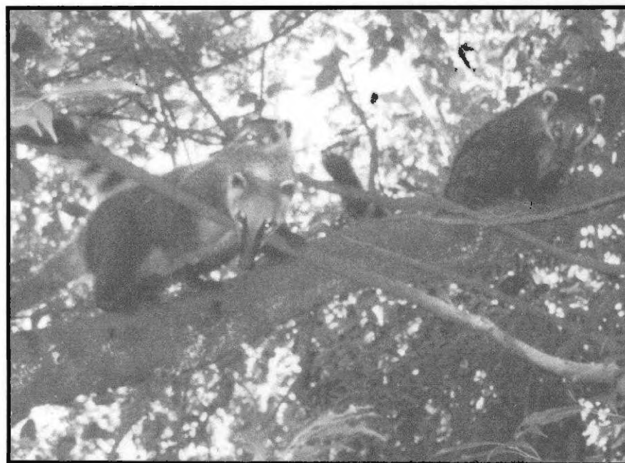
Figura 8 - Quatis do Horto. (Fonte: Jornal da Comarca).