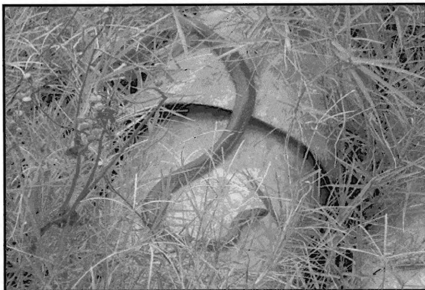
Figura 07 – Cobra